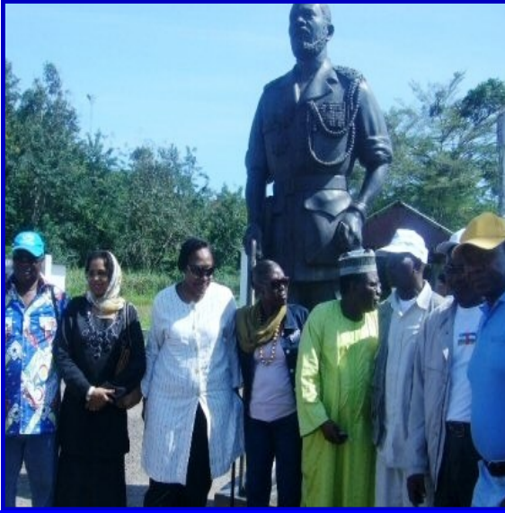
Les membres du forum des Ambassadeurs africains et Mme Vogt à l'ancien Palais impériale de Béréngo

Toujours dans le cadre de la semaine de la paix, le forum des Ambassadeurs africains en poste en Centrafrique en partenariat avec l'Union Africaine (UA) s'est rendu le 23 Septembre 2011 à Baléloko, localité située à 130 KM de Bangui sur l'axe Mbaïki, en vue de porter assistance aux minorités, pygmées AKA. Ce geste humanitaire a permis la remise des médicaments