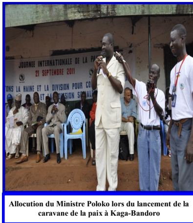
Allocation du Ministre Poloko lors du lancement de la caravane de la paix à Kaga-Bandoro

« Cette année la célébration a eu lieu à Bangui le mercredi dernier et aujourd'hui à Kaga Bandoro qui a vécu des moments difficiles. Heureusement que la paix est revenue progressivement grâce au dialogue, à la concertation et à la tolérance. C'est un atout important dans la quête de la paix qui explique la présence de l'ONU en RCA depuis plus de dix ans et notre raison d'être ici.