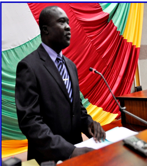
Le Ministre de la Communication M. Alfred Tainga Poloko lors de son allocution

nale à œuvrer inlassablement pour éradiquer l'esprit des guerres, en précisant que la reconstruction d'un Etat nécessite la stabilité et la quiétude. Pour qu'il y ait la paix, il faut qu'il y ait la démocratie, mais la démocratie doit être effective dans un Etat où toutes les Institutions républicaines sont respectées, a martelé le Président François Bozizé.