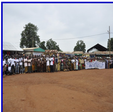
Public assistant au lancement de la caravane de la paix à Kaga-Bandoro

Le 21 septembre dernier à Bangui, le Chef de l'Etat, l'ONU et l'UA ont délivré des messages forts face à la situation préoccupante qui se passe dans la vakaga. C'est le moment de dire STOP, stop aux conflits, stop aux exactions et vivent la concertation et le dialogue pour un avenir meilleur de la République centrafricaine. Nous sommes résolument avec vous, faisons entendre notre voix pour une paix durable dans le pays du ZO KWE ZO de Barthelemy Boganda».