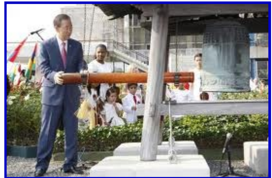
Ban Ki Moon sonnant la cloche de la paix le 15 Septembre 2011 au siège de l'ONU

À tous ceux qui veulent la paix, nous disons : cette journée est la vôtre, et nous sommes avec vous.