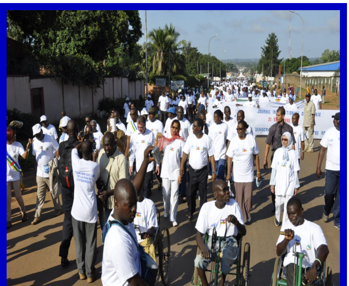
Les marcheurs précédés par les handicapés moteurs

La marche a pris fin à l'Assemblée Nationale où Mme la Représentante spéciale du Secrétaire général des Nations Unies, Mme Margaret Vogt, a remis la flamme de la paix au Président de l'Assemblée Nationale, puis au Président de la République François Bozizé.