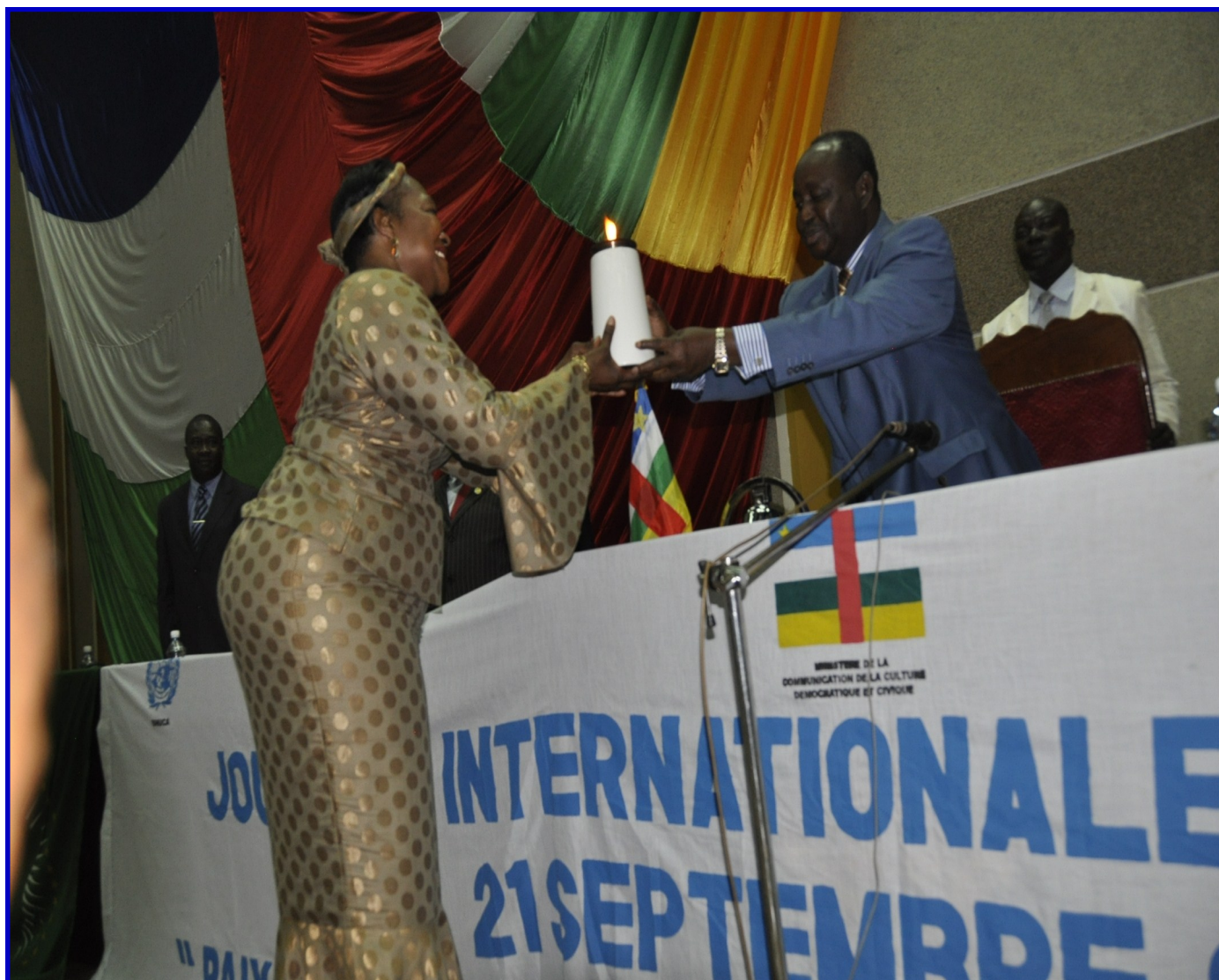
Mme Margaret Vogt remettant la flamme de la paix au Président de la République François Bozizé lors de la célébration officielle de la Journée Internationale de la Paix 2011

LES AUTORITES CENTRAFRICAINES, LES NATIONS UNIES, L'UNION AFRICAINE ET LA POPULATION FONT ENTENDRE LEURS VOIX POUR LA PAIX EN CENTRAFRIQUE