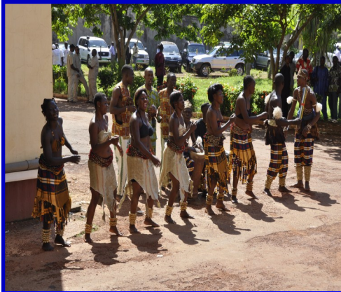
Animation à l'Assemblée Nationale par le groupe de danse 'Zéké Ti Béafrica'

A l'endroit de la Représentante spéciale du SGNU, le Président Bozizé a déclaré, « nous remercions Mme la Représentante spéciale du Secrétaire général des Nations Unies en RCA pour tout ce que réalise le Système, particulièrement pour enraciner la culture de la paix en RCA ».