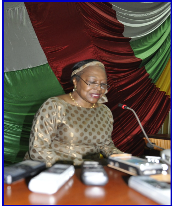
Mme la Représentante spéciale du Secrétaire général des Nations Unies en RCA délivrant son message