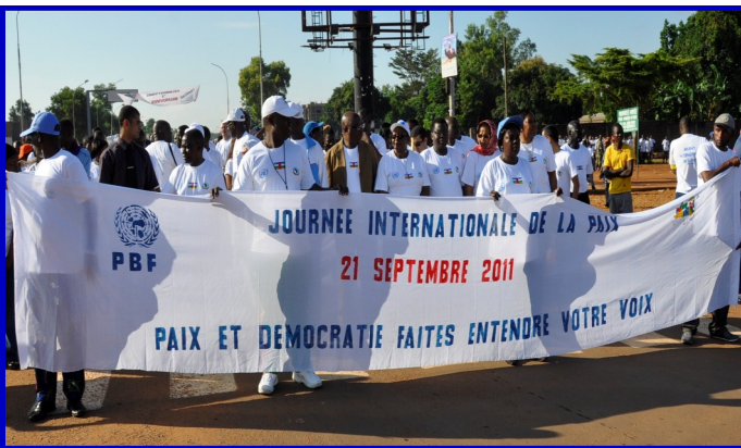
Départ de la marche

La célébration de la Journée Internationale de la Paix débutée au Siège des Nations Unies à New York s'est poursuivie en Centrafrique sous le thème de l'année, 'Paix et Démocratie : Faites entendre votre voix'.